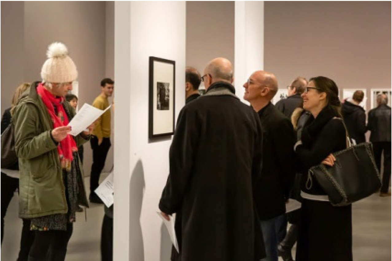
Eröffnung / Opening Biennale für aktuelle Fotografie 2020 The Lives and Loves of Images, Kunsthalle Mannheim, 28/02/2020

Die Ausstellungen der Biennale öffnen wieder!